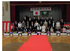
【新1年生・保護者と共に】

学校の全教育活動において、互いのよさを認め合う支持的風土の下、自分のよさを発揮できる児童を育成していくことが、教育目標の実現化の一助であると考えております。子供たちが笑顔で、今日が楽しく明日が待たれる中野西小学校になるように全教職員で取り組んでまいります。保護者の皆様、地域の皆様のご支援とご協力をどうぞよろしくお願いいたします。