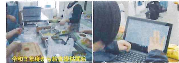
令和3年度から給食提供開始