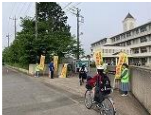
【あいさつが交わされ、笑顔で門を通過していきます。】

5月16日(金)、民生児童委員合同あいさつ運動が行われました。元気なあいさつが交わされ、気持ちよく登校できました。