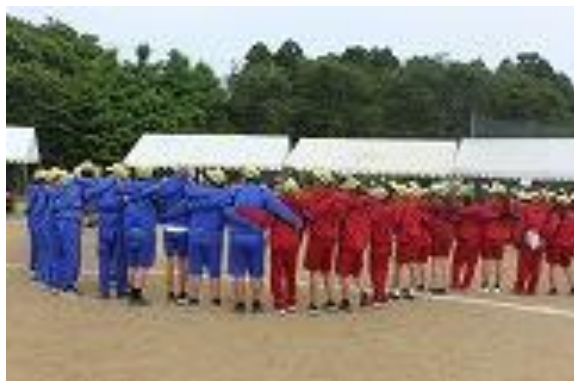
【お互いの気持ちを高め合い、団結する生徒】

体育祭の講評で、「みんなで作り上げた体育祭は素晴らしかったです。一人一人が輝いていました。団の団結力も力強く、応援合戦は見応えがありました。皆さんには、周りの人を感動させる力があります。この力でさらに大野中を盛り上げていきましょう。」と、生徒に伝えました。どこからともなく、拍手が沸き起こりました。うれしい気持ちがかみ上げてきました。