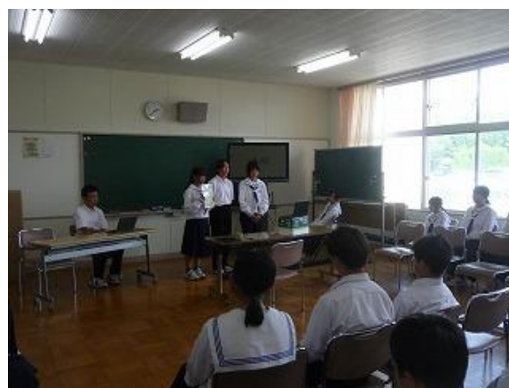
【学級訓といじめ撲滅標語の発表】

最後に、学校のスローガンを生徒の皆さんに伝えました。「 おおきな夢に おおきく前進 のびゆく 大野中学校 」です。大きな夢をもって3年間を過ごし、将来に向かって大きく進んで欲しいという願いが込められています。大野中学校の生徒が、さらに伸びていくことを期待するばかりです。