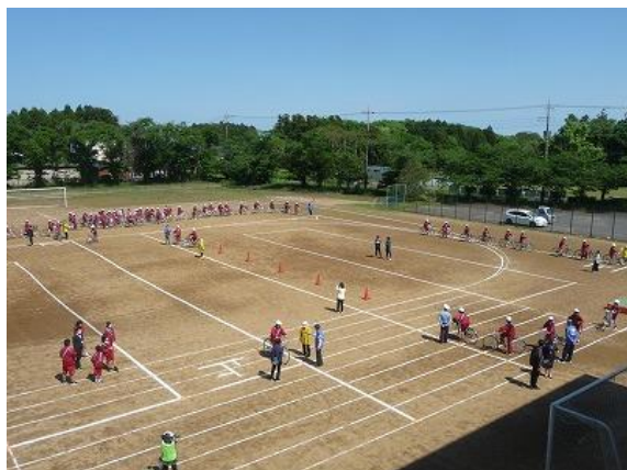
【安全な走行、練習中】

5月8日(水)、4月の避難訓練に引き続き1年生の交通安全教室が行われました。鹿嶋警察署員の方をはじめ、交通安全協会、交通安全母の会、民生委員・児童委員の皆様にご協力をいただき、自転車の安全な乗り方の再確認をしました。運行点検項目「ぶたはしゃべる」で確認した後、校庭のコースを走り、安全な乗り方・走行についてアドバイスをもらいました。自分の命を守るための乗り方をしっかりと意識できたようです。