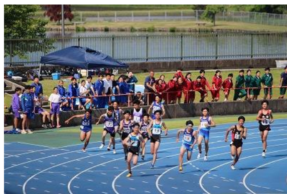
【チーム大野の後押しは、選手を勇気づけます。】

5月13日(火)、県東地区陸上競技会が水戸市ケーズデンキスタジアムで行われました。本校代表は、持てる力を十分に発揮してきました。陸上競技の素晴らしいところは一人一人の記録が残るといえるところです。それは自分との戦いの結果です。努力が実を結び、上位入賞を果たした生徒もいました。自分の力を試そうとする積極的な心は、誇りに思っていると思います。